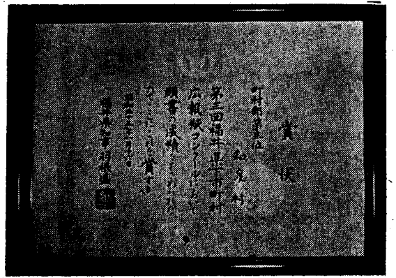
賞状 県広報コンクールに町村部第三位入選

一、構築について (1) 製炭の成績は炭窯の構造、気候並びに立地、樹種、樹齡、操作の方法等、極めて多くの原因によつて左右されるのであるから、製炭窯の構築に当っては充分注意せねばならない。 特に本村は山林面積が一八、九〇〇畝あり、この内の大部分が新炭林であるが、年々歳々の生産で奥山へ奥山へと移行する現状である。従つて製炭原木も雑木が多く多種に渉り、ブナの原始林