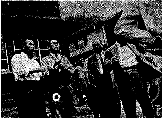
伊勢湾台風による 災害の復旧状況が未 だ七〇%に達しない 時、十一号、十二号 台風更には十六号台 風と矢次早に而も十 六号台風の如きは一 日約五百ミリの集中 豪雨をもたらした、三 十四年災の被害箇所 をようやく復旧完成 した箇所等も含め伊 勢湾台風にも勝る災 害を蒙り而も之が復 旧に關しては高率補 助の特別立法法等全 く不明であり、万 一特別措置が講じら れない限り村民個々の 経済状態は勿論有史 以来の膨張し逼迫せる村財政を以