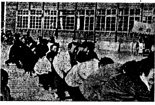
菊花賞十一月三日、全村挙げてのレクリエーションスポーツとして、下地区で恒例の村民運動会が開催された。