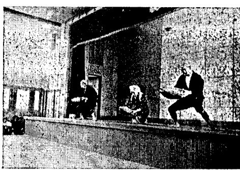
和校で開催されました。午前十時から酒宴を開き、午後には青年団婦人会総出の演芸会を催しました。青年団は舞台にも馴れています。婦人会は未だ一度も舞台へ登つた事のない人はかりですが、真心中で御老人をおなごめしたいという一心から力いっぱい踊りなどを致しました。

6、雪... 新聞やラジオの報道によると、今年には雪が多いとのこと。供にとつて強い魅力であるが、家庭も忙しみのため子供への目が自然に届かなくなり、こんなことから歳末は、子供たちの不良化、犯罪の出発点になることが多いから、各家庭でも