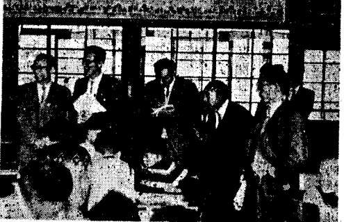
(写真は上、合同研究発表会下、第一会場に於ける一コマ)