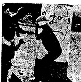
写真 上は顔書きリレーの一コマ 下、小学生鉢巻姿の綱引き競争

恒例の十一月三日文化の日行事は、朝のうちに残った小雨はどしゃぶり、午前十時頃には絶好の晴天に恵まれ、下地区は朝日中学校庭で、赤、白、青、緑、黄、の地区別対抗試合で国旗に続く村民大会の旗の入れ場、選手宣誓等オリオンピクニックムードよく熱戦をくりひろげた。結局緑チーム(長野、鷲、川合、貝皿)が優勝した。 一方上地区は東部中学校庭に於いて抽せん付大会参加賞が人気を呼び、種目は職員リレー、ユニホーム競走、変ったところでは婦人会の顔書きリレーなど抱腹絶倒の場面を度々展開、爆笑の中に、楽しい健康に満ちあふれた一日を過ごした。