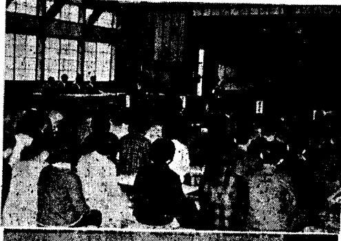
(写真は上、合同研究発表会下、第一会場に於ける一コマ)

昨三七年四月、へき地複式教育の研究を指定された朝日小学校は、日進、大和、大納等各小学校並びに村内小学校研究部、複式研究部と提携協力を得て二カ年に亘るへき地教育の在り方について教科経営、学校運営の二面から深く掘り下げた研究をなして、去る十一月六日、朝日小学校で発表会を行った。当日は県教委主務部を始め大野市教委の指導陣及び県内各地からへき地教育に関心の深い校長、教員五十名、村内教員五十余名が参加し、第一会場を朝日小学校（主として単式教育の研究）第二会場を後野分校（主として複式教育の研究）に別れ、各々所属部門の教育内容の検討に熱心な討議発表を交換し、最後に朝日小学校で合同研究を行ってしめくくり会合した。 集る教師百余名は真剣な面もちで、へき地の子供の幸福を願ひ、