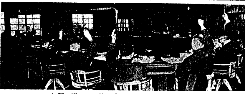
(写真は挙手採決の一瞬)

三月十九日午前九時から和泉村役場に三月定例会が招集され、昭和三十九年度一般会計予算など次の四十一議案が上程された。