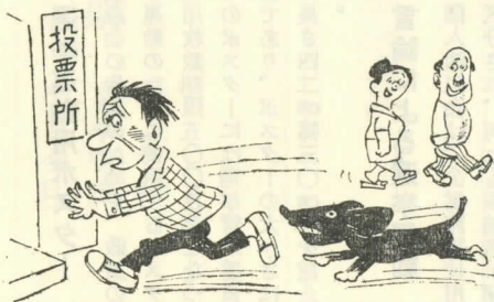
犬は知っていた！ 「棄権はいけませんよ、ワンワン」

せっかく与えられた尊い大切な一票を棄権するというようなことのないよう、またあなたがあなたの信頼できる人にこれから四年間安心して村の政治を任せるために、皆さんがそろって投票所へお出かけ、いつまでも良かったといわれる悔いのない一票を投じましょう。