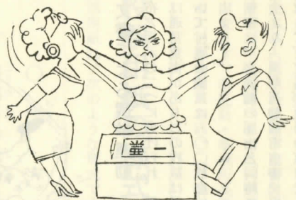
この一票人のさしずは受けません