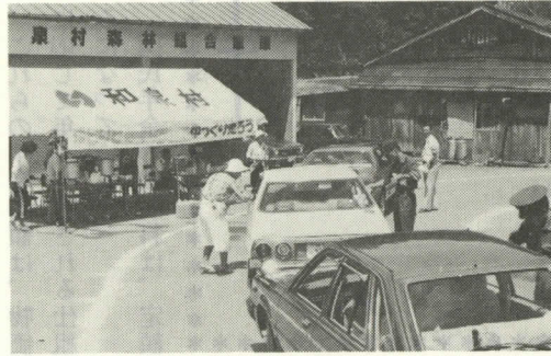
暑さに負けず正しい運転"をと呼びかけた。

観光客や所用で和泉村を通行する車に「ちよつと一ぷく」してもらい、冷たいお茶をサービスし、マッチ、パンフレットなど配布して、旅の疲れを少しでも休めてもらい、暑