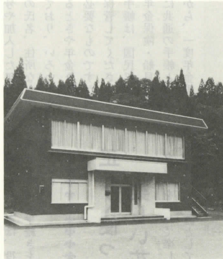
農村集落多目的集会施設(下山)

昨年からの継続事業として、工事を進めていた山村開発センター（朝日）と農村集落多目的集会施設（下山）がこのたび完成しました。 この両施設は、村民に集団的活動の場を提供し、地域産業の振興と生活文化の向上を図り、併せて後継者の育成と定住化の推進に寄与するために設置されました。