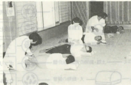
▲理療を受けるお年寄り

七月十三・十四日の両日、村内六十歳以上の老人及び身体障害者を対象に福井県立盲補欠員 島 光義(班 長) 学校生徒による針・あんまの