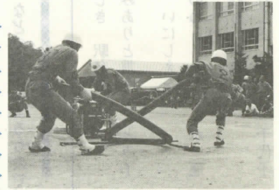
▲県消防学校グラウンド

本村からは大野地区消防組合を代表して、次の第二分団が小型ポンプ操法の部に出場しましたが、健闘およばず入賞できませんでした。