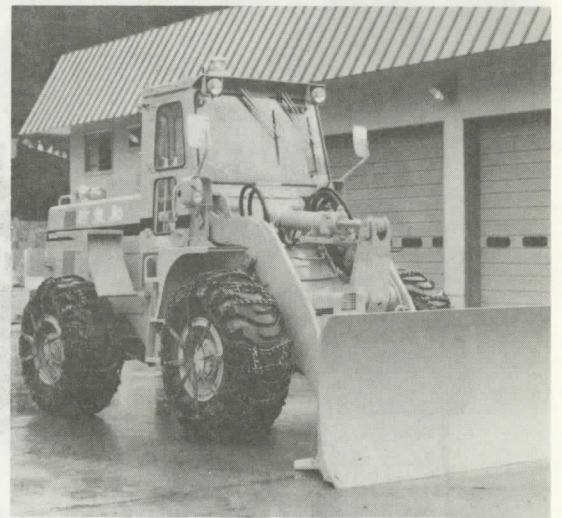
(更新した除雪ドーザー) 型式—小松530BSA式 12t