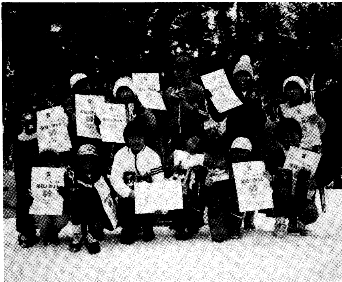
上位を独占した朝日小学校の入賞者（県小クロス大会）