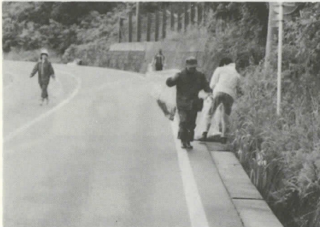
ご協力ありがとうございました。

参加団体は、観光協会・婦人会・青年団・建設業会・宿泊振興会・森林組合・商工会・農協・郵便局・消防分遣所・役場です。