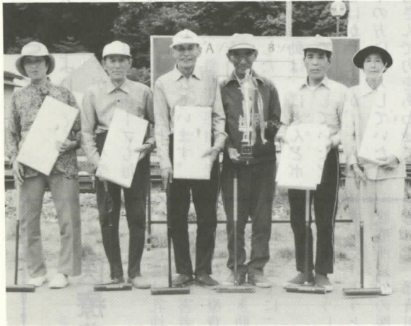
トロフィーを手にする後野チーム

加し、二つのゾーンで予選リーグを行い、後野と川合・貝混成チームが決勝に進み、熱戦の結果、後野チームが優勝しました。