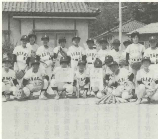
朝日小スポーツ少年団

本村から出場した朝日小スポーツ少年団チームは、準決勝まで勝ち進み、三位に入賞しました。