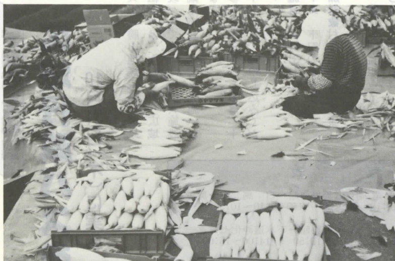
出荷の準備をする後野婦人グループ

が中心となって「穴馬カブラ」の特産化をめざし初出荷したところ、各方面から大変好評を得て特産野菜としての可能性十分という良い方向に進ん