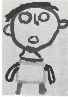
「おとうさん」 もりお つばさくん