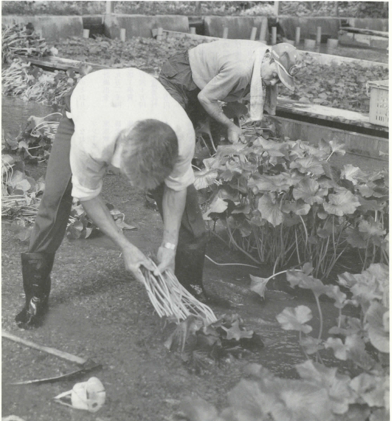
(下山荒島谷の水ワサビ収穫風景)