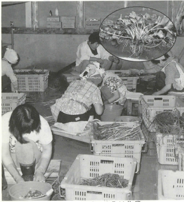
ワサビの仕分け作業