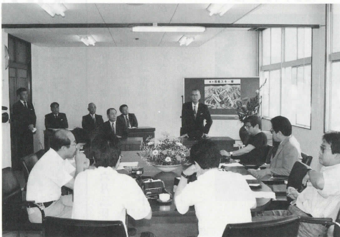
◀起工式に先立って和泉村役場で記者会見がありました。

蛇鏡山一帯は降雪が早く雪の質がよく量が多いのと斜面が北東向きのため、スキーは十二月上旬から四月上旬まで可能で、県内では最も長い期間滑走できるスキー場になります。近江鉄道ではバスなどによる大量輸送も考えており、中京、関西などから初年度は五万人、完成年度には十万人のスキー客を見込んでいます。