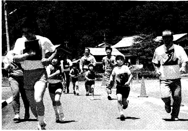
▲ お父さん、お母さん ガンバッテね!