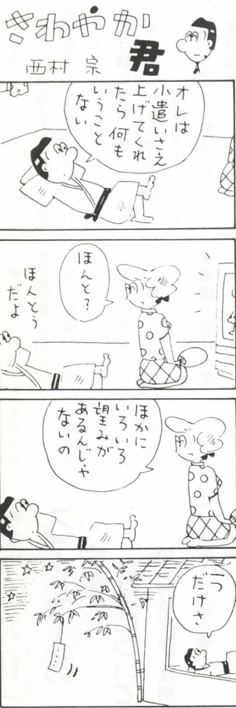
かわわが君 西村 宗