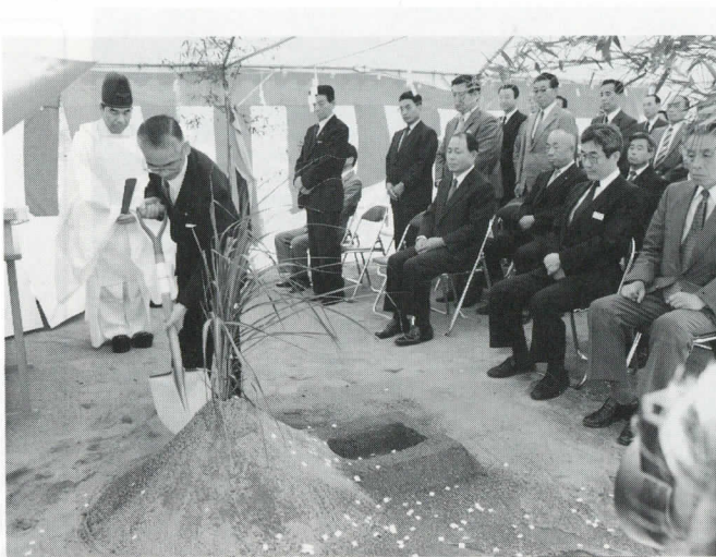
▶和泉スキー場の起工式で神事を行う村長

スキー場の総面積は二百餘標高一〇〇㍎から六〇〇㍎に七つのコースを設け、コースの延長はいずれも約千㍎で平均斜度一〇度、最大二三度初心者から上級者まで楽しめる全長八百四十二㍎と千百二十一㍎の四人乗り（北陸では初のフード付）高速リフト二基と七百四十八㍎の二人乗りのロマンスリフト二基を設ける