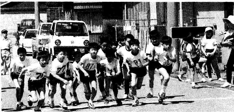
▲ ゴールめざして よお〜い どん!

第十二回和泉健康マラソンが六月三日(日)、中央公民館前で開かれました。この日は幼稚園から一般まで百二十七名がゴールめざして力走。成績は次のとおりでした。